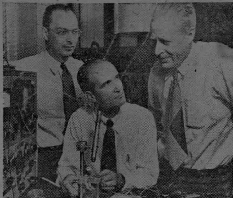
Doctores John Bardeen, William Shockley y Walter Brattain, de izquierda a derecha, ganadores del Premio Nóbel de Física 1955, por sus descubrimientos en el campo del desarrollo electrónico