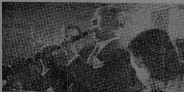
Benny Goodman, el gran intérprete del clarinete, en música clásica y jazz, después de haber recorrido triunfalmente, con su orquesta varios países de Asia, fue objeto de un homenaje en Estados Unidos. Sus proyectos para el futuro comprenden un recorrido artístico por los países de la América Latina, entre los que figuran México, país en donde Benny Goodman goza de enorme popularidad