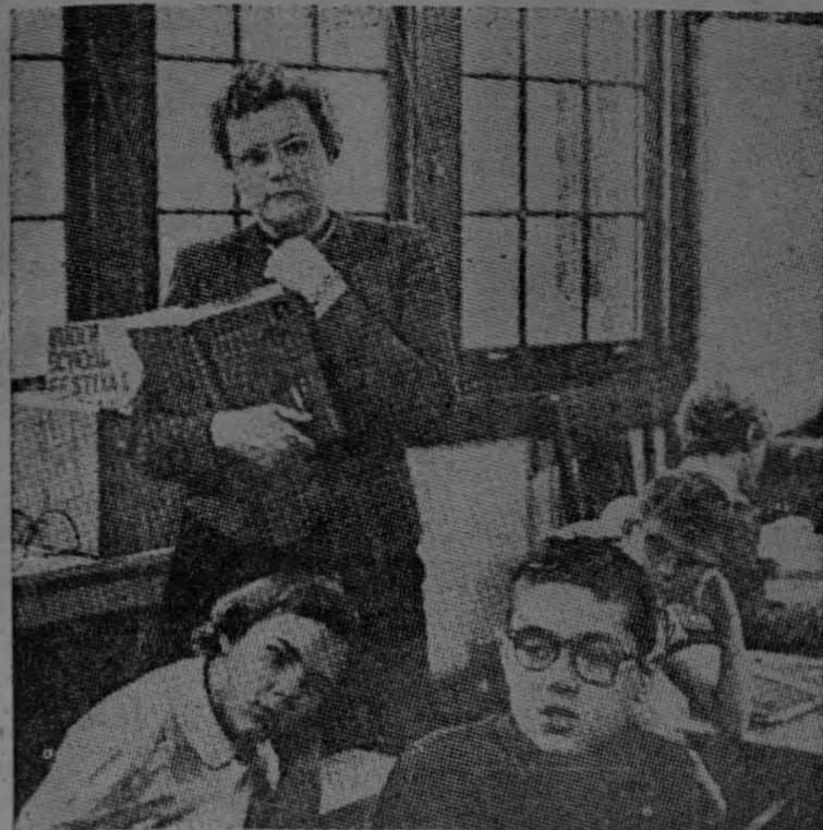
Dos de los estudiantes "sabios" examinan atentamente un difícil problema matemático expuesto en el tablero de la clase, mientras su profesora espera los resultados del examen

El problema de los niños precoces, llamados generalmente "niños sabios", ha preocupado hondamente a los educadores de todos los países del globo. Diferentes experiencias se han efectuado para tratar de establecer nuevos sistemas educativos destinados exclusivamente a obtener el mejor aprovechamiento educativo en favor de los niños más privilegiados.