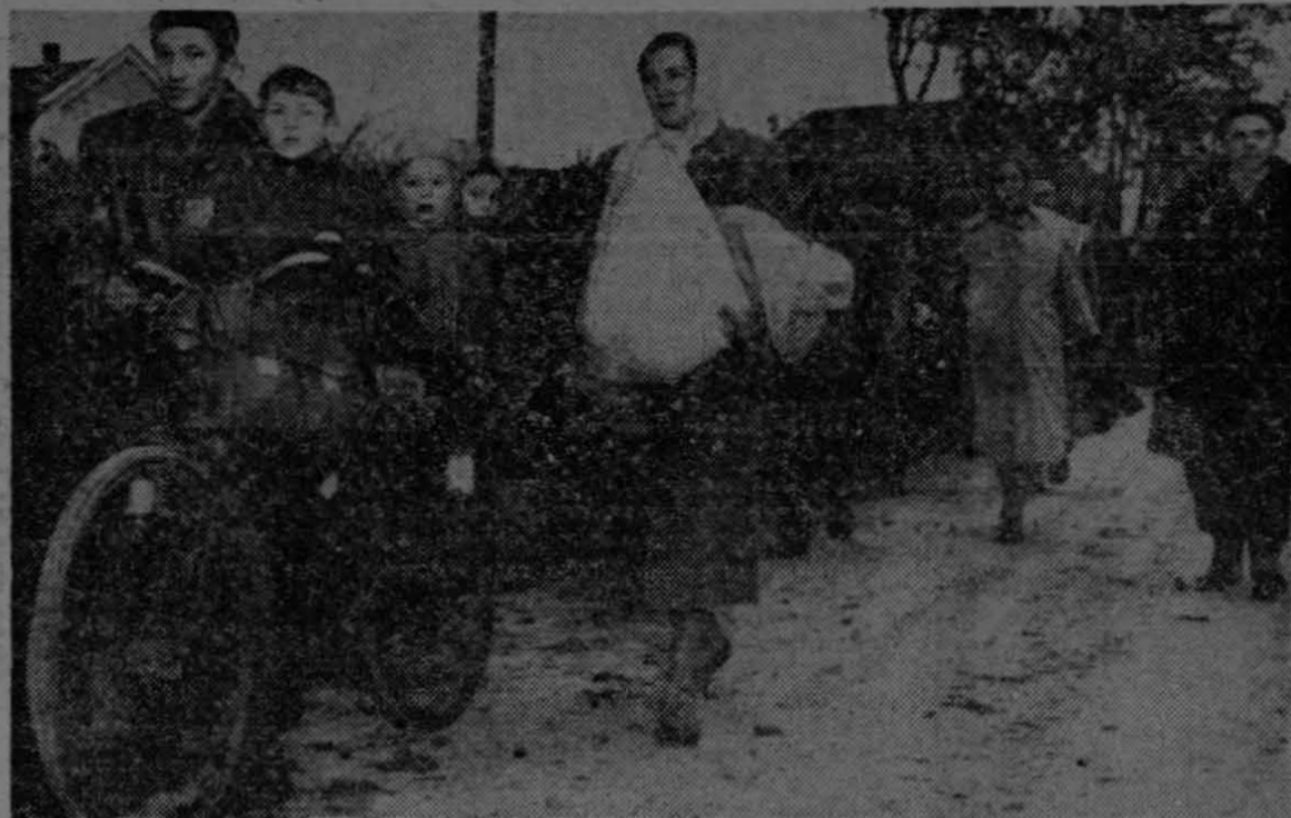
Patética vista de un grupo de habitantes de Hungría, dirigiéndose a pie, en bicicleta a través de los caminos del sur de su patria, para hallar refugio en la hospitalaria Austria, desde donde serían trasladados a otros países libres que también generosamente brindaron su tierra para que los perseguidos por la tiranía soviética pudieran reorganizar sus vidas.